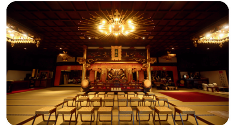
【安産祈願/祈禱】鬼子母神縁日である8の付く日は、一般の皆さまもお気軽にご祈禱をお受けできます。