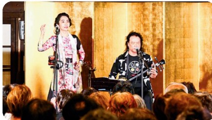
【催し】社会に開かれたお寺を目指し、様々な行事・イベントを開催しています。