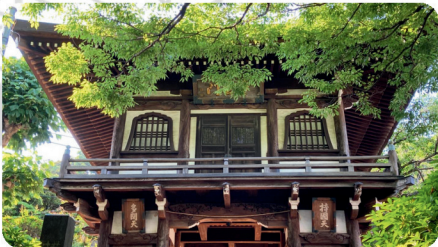
【歴史】1873年に草創、150年もの長い歴史を持つ古刹です。

横浜南太田の地で、古来より守り継がれるお寺です。毎月8のつく日に、“子供の虫封じ”や“夜泣き止めの祈禱”をはじめ、安産祈願・厄除けなどの祈禱を行っています。お気軽にご参拝ください。